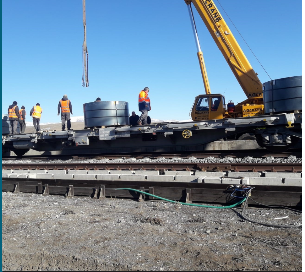
RUSYA MENŞEİLİ RULO SAÇ TAŞIMALARI

Rusya çelik sanayi devi rulo sac taşımaları ile BTK hattına dahil olmuştur ve deniz yolu taşımalarının büyük bir kısmını demiryolu ile yapmaya başlamıştır.