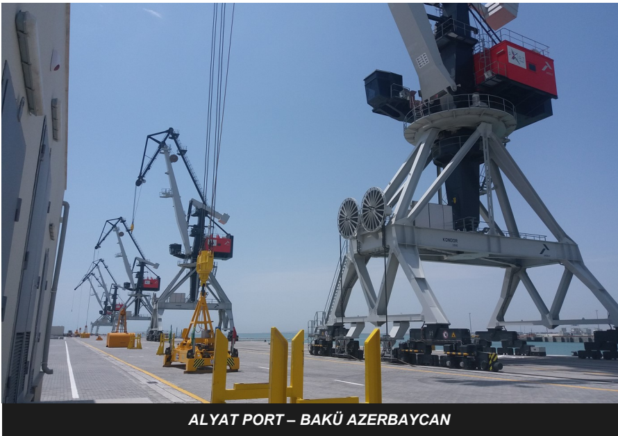
ALYAT PORT – BAKÜ AZERBAJCAN