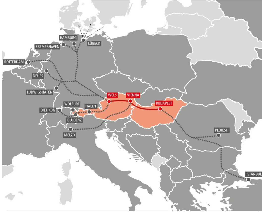
AVRUPA BLOK TREN TAŞIMALARIMIZ

'Haftalık gidiş dönüş olarak 2 blok tren çıkışı gerçekleştiriyoruz'